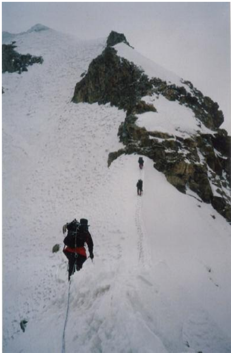
2. DIENAS VAKARS PIRMS IZEJAS UZ Z KORES