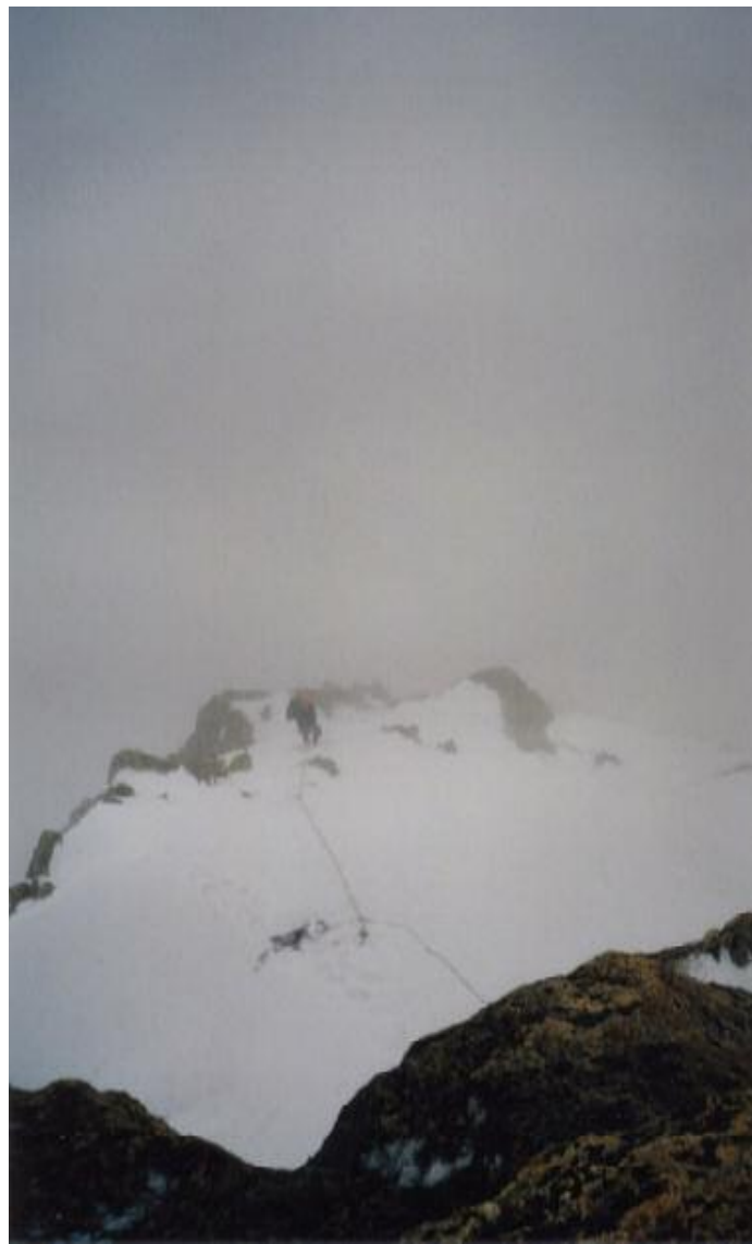
2. DIENA BARANOVSKIS PĀRVAR SNIEGA KORI