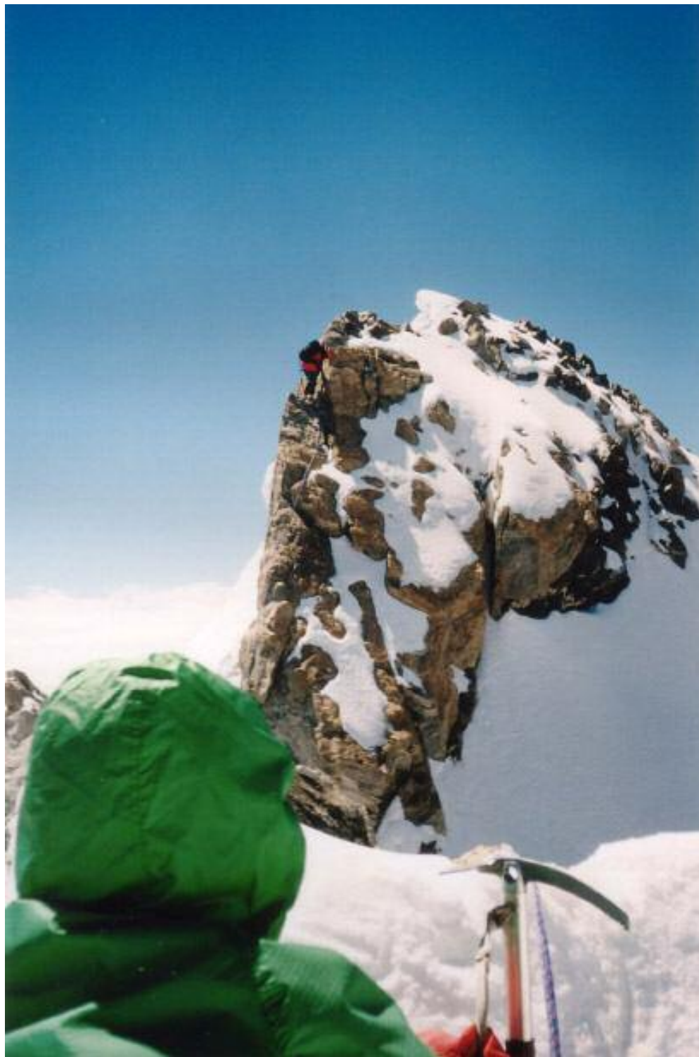
K. KLAPKALSNS UZ KLINTĪM PIRMS VIRSOTNES