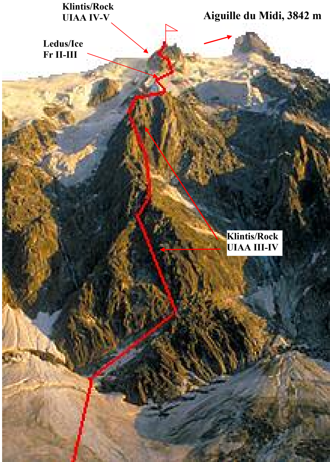
Aiguille du Midi virsotne un Frenido Spur maršruts