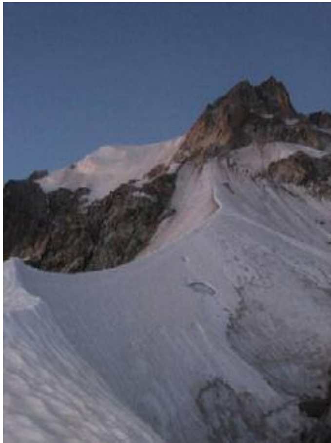
Sarežģītākais posms – ledus nogāze un V kategorijas klintis maršruta augšdaļā The key pitches - ice slope and rocks of grade V on upper part of