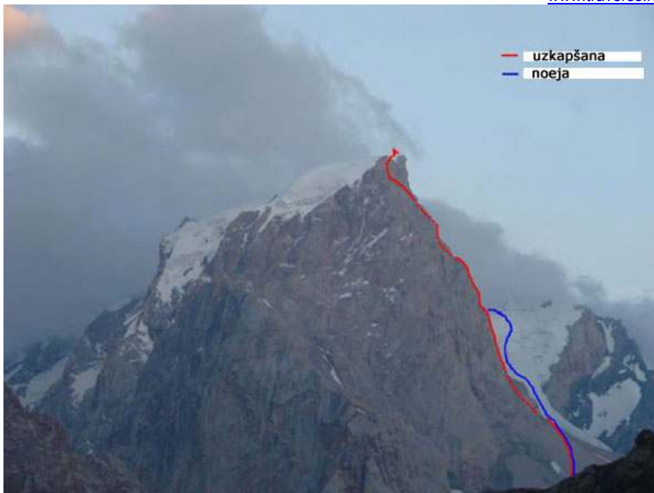
Kāpiena masršruta linija un nokāpšanas ceļš