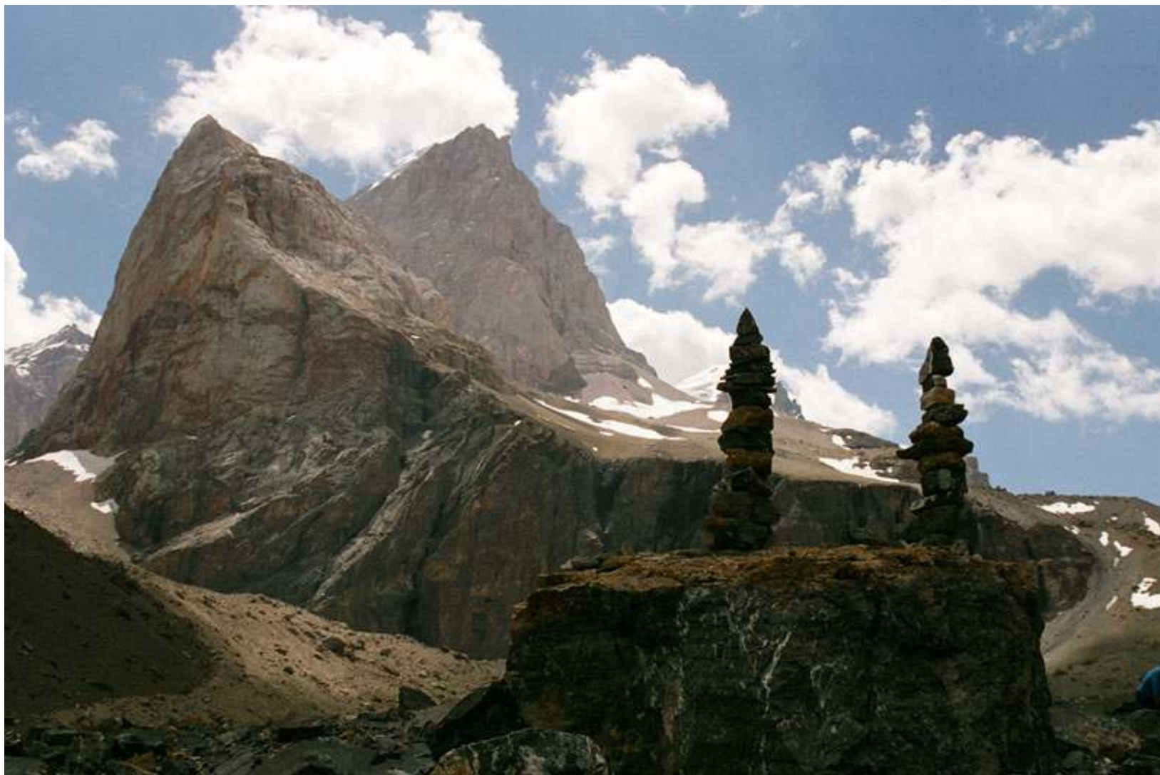
Zamok un Parandass virsotnes no trešā pakāpiena uzkapšānas ielejā